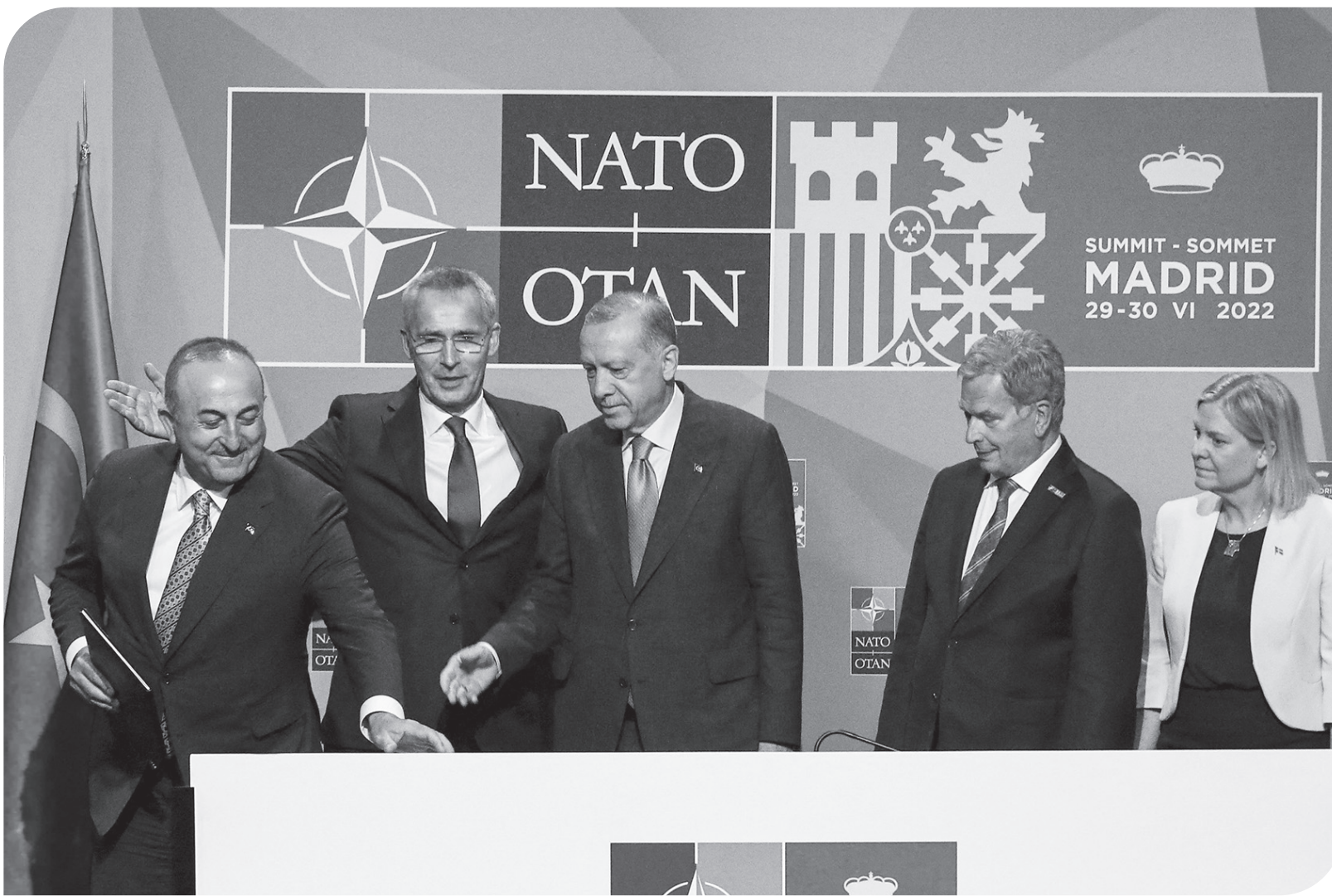
KONFERENSI TINGKAT TINGGI NATO DI MADRID - SPANYOL

Presiden Turki Tayyip Erdogan, Perdana Menteri Swedia Magdalena Andersson, Sekretaris Jenderal NATO Jens Stoltenberg, Presiden Finlandia Sauli Niinistö, dan Menteri Luar Negeri Turki Mevlut Cavusoglu terlihat setelah menandatangani sebuah dokumen pada Selasa (28/6), di tengah KTT NATO di Madrid, Spanyol.