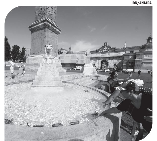
GELOMBANG PANAS MENYERANG ITALIA Warga mendinginkan diri di air mancur Fontana dei Leoni di Piazza del Popolo, Roma, Italia, pada Selasa (28/06), saat gelombang panas menyerang negara tersebut.